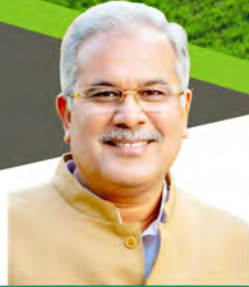
श्री भूपेश बघेल माननीय मुख्यमंत्री, छ. ग. शासन

स्थान: कृषि उपज मंडी समिति ग्राउंड, बेमेतरा, छत्तीसगढ़