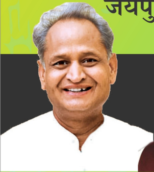
श्री अशोक गहलोत माननीय मुख्यमंत्री राजस्थान

स्थान: श्री कर्ण नरेन्द्र कृषि विश्वविद्यालय, जोबनेर, जयपुर, राजस्थान